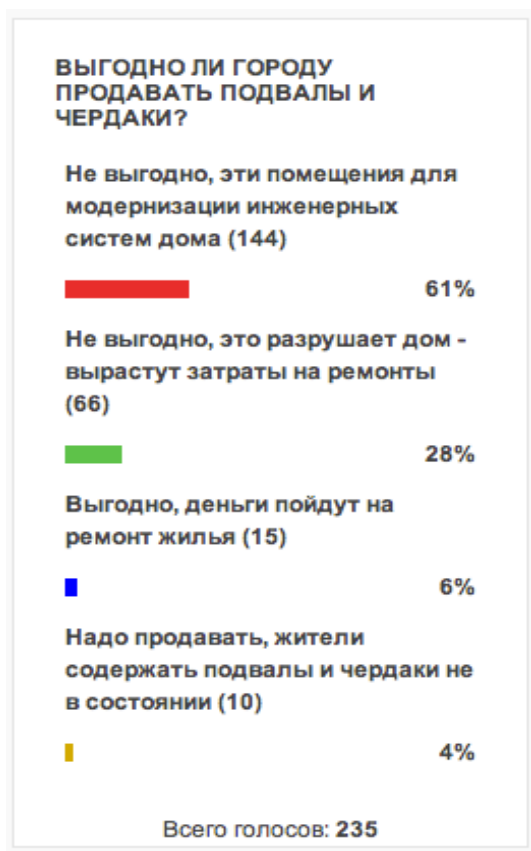
Диаграмма результатов опроса сайта ТСЖД.ру по вопросу: «Выгодно ли городу продавать подвалы и чердаки в жилых домах?»

Результат опроса показан по состоянию на 20.10.2012г., голоса распределились следующим образом: Не выгодно, эти помещения для модернизации инженерных систем дома ответили - 61% респондентов.